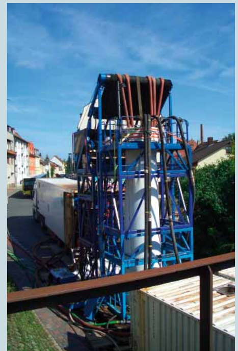
Inversionsturm mit Heizschläuchen während der Härtungsphase.