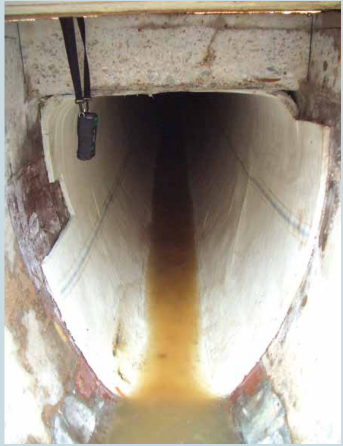
Ungewöhnlicher Querschnitt: Eiprofil „mit Deckel“.

Die statische Berechnung wurde mittels „Finite Element – Methode“ (Simulations-Software) nach ATV M 127, Teil 2 durch die eigene Statikabteilung der Firma Insituform durchgeführt. Wie (fast) zu erwarten war, ist der kritische Bereich des Profils der Scheitel, in dem die höchsten Biegezugspannungen unter 2-fachen Lasten auftreten. Für den ebenfalls geführten Verformungsnachweis unter Gebrauchslasten war jedoch der Kämpfer maßgebend, so wie es bei einem „normalen“ Eiprofil auch der Fall wäre. Es ergab sich eine Wanddicke des zu liefernden Liners von 30mm.