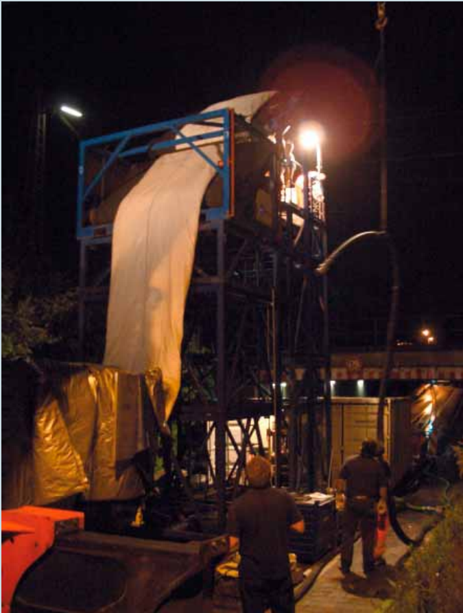
Um die Sperrung der Unterführung zu minimieren, wurde die Nacht durchgearbeitet.