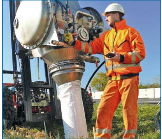
Inversion mittels Chip-Unit (Dampf-Warmhärtung)

Insituform® Rohrsanierungstechniken GmbH verfügt über folgende verfahrensspezifische Prüfungen und Zertifikate: