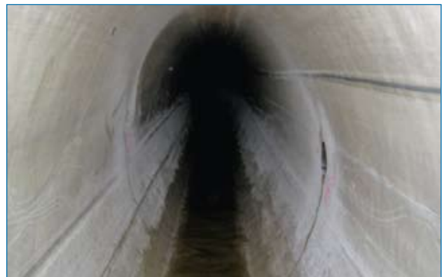
Renoviertes Ei-Profil im begehbaren Bereich