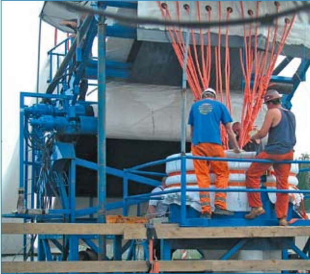
Beginn der Inversion Hamburger Oberhafendüker