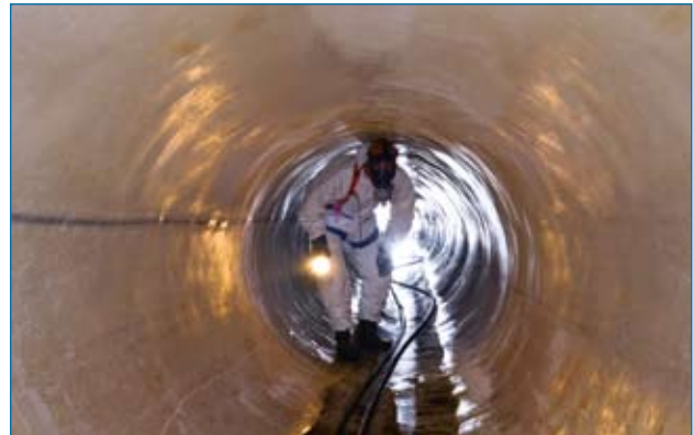
Sanierter Mischwasserhauptsammler DN 1600