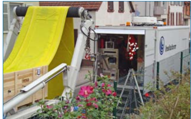
Materialschonender Einbau Liner DN800 mittels Einbauhilfe