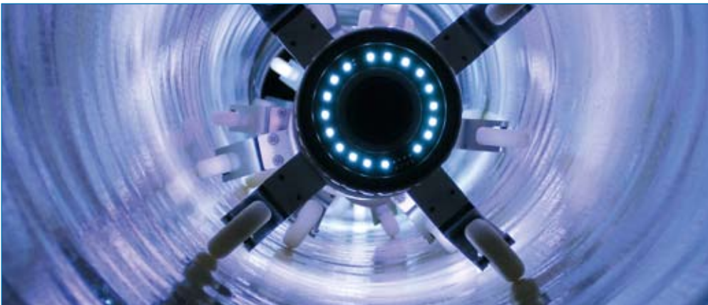
UV-Härtung des Schlauchliners

In der grabenlosen Renovierung von Kanalsystemen hat sich das Schlauchlinerverfahren mit UV-Härtung als sichere, schnelle und kostengünstige Sanierungsmethode etabliert. Deshalb bietet Insituform Rohrsanierungstechniken GmbH neben dem warmhärtenden Insituform Schlauchliner auch den UV-Licht härtenden und DIBT-zugelassenen iMPREG Liner an.