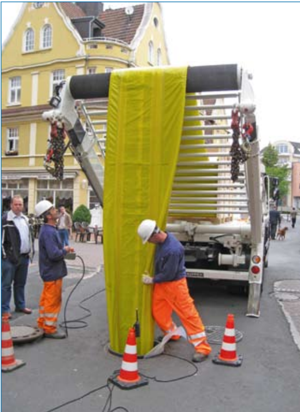
Installation eines Ei-Profiles DN 500/700

#01 VERFAHRENSPROFILE #02 QUALITÄT #03 REFERENZEN