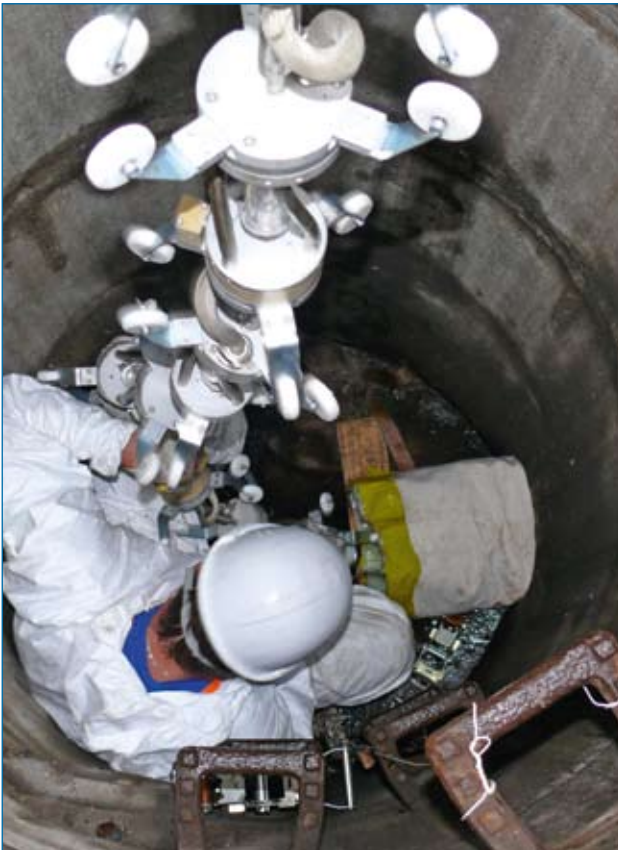
Einbringen der Lichterkette