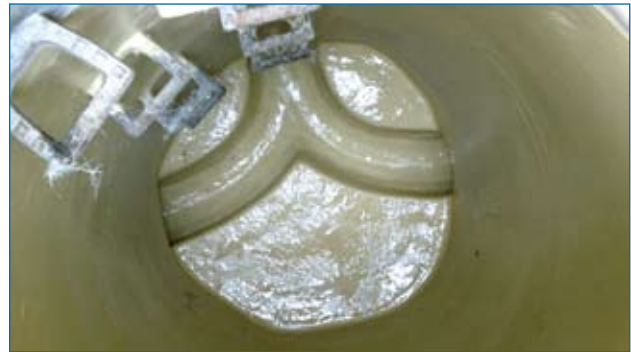
In GFK-Handlaminat ausgekleidete Schachtsohle

Je nach chemischer Belastung kann man Polyesterharz oder Vinylesterharz einsetzen.