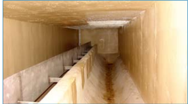
Auskleidung eines Regenüberlauf-Bauwerks mit GFK-Platten