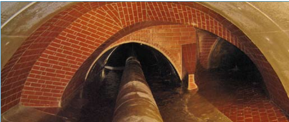
Mit Keramikplatten ausgekleidetes Bauwerk

Die Oberflächenbeschichtung mit keramischen Elementen beinhaltet den Einbau von Keramikplatten in Abwasserkanälen sowie Schacht- und Sonderbauwerken. Ziel ist es, Abwasserkanäle, Schacht- und Sonderbauwerke chemisch und mechanisch hoch resistent auszulegen, um einen einwandfreien sowie verlustfreien Transport sicher zu stellen und die Umwelt nachhaltig zu schützen.