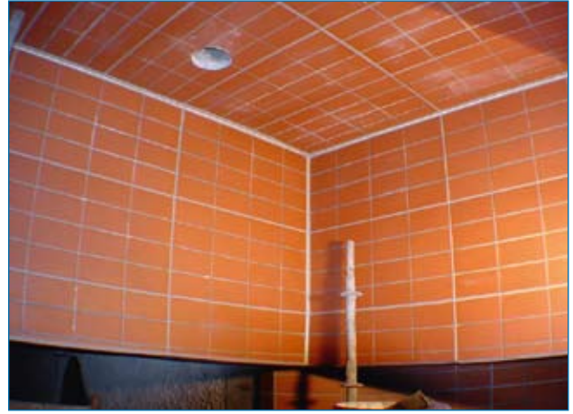
Mit Klinkerplatten ausgekleidetes Bauwerk

Ergebnis der Arbeiten ist ein dichtes Abwassersystem mit einer hohen Nutzungsdauer und den sich daraus ergebenden geringeren Abschreibungskosten pro Jahr.