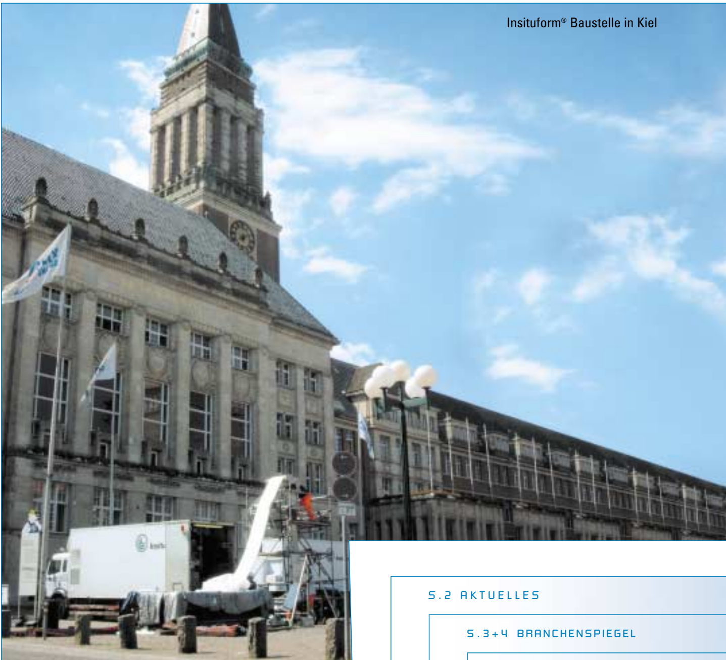
Insituform® Baustelle in Kiel