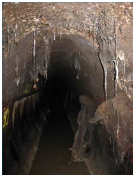
Der Kanal vor der Sanierung

Ende April 2007 erhielt die Insituform Rohrsanierungstechniken GmbH, von der SWK AQUA GmbH, einem Tochterunternehmen der Stadtwerke Krefeld AG, den Zuschlag für eine Kanalsanierung in der Sprödentälstraße: Ein Kanal der Dimension Ei 1400 / 2100 sollte auf einer Länge von 95 m mittels Schlauchrelining ausgekleidet werden.