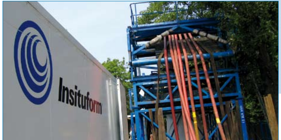
Die Baustelle während der Aushärtephase

Nach dem Einkrempeln des Schlauches mussten jetzt die etwa 240 m 3 Prozesswasser auf die definierte Reaktionstemperatur erhitzt werden. Mit drei Heizanlagen, die zusammen über 4000 kW Heizleistung aufbrachten, gelang