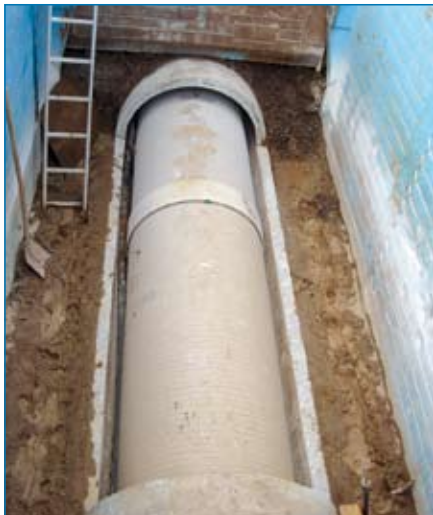
Montagegrube nach Rohreinbau

Die vorhandenen 42 Zwischenschächte, welche tangential im Kanal angeordnet sind, wurden im Zuge der Baumaßnahme mit saniert. Es erfolgte ein Austausch der Schachtabdeckungen, der Steigeisen und eine Beschichtung der Schachtwände mit kunststoffmodifizierten Spezialmörtel von Ergelit.