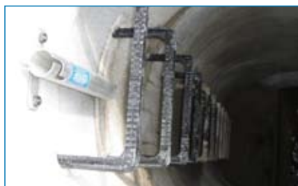
Schacht vor und nach der Sanierung