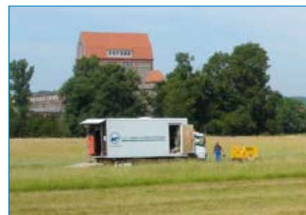
Rohrlager und Reliningsanierungseinheit

Um die Rohre DN 1000 in den zwischen 2,50 m