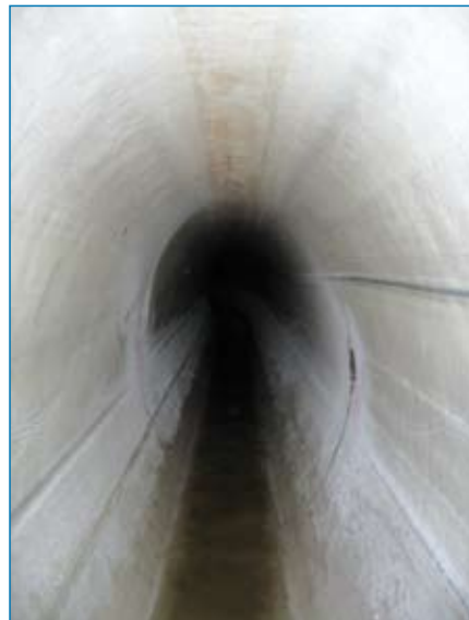
Blick in den sanierten Kanal

dies wie geplant. Während der Aushärtephase wurden die Prozesstemperaturen sowohl am Anfangs- und Endschacht als auch innerhalb der Kanalhaltung mittels Temperaturfühler überwacht. Die nachvollziehbare Aufzeichnung und Protokollierung dieser Daten erfolgte über ein elektronisches System. Vom Aufheizen bis zum Herunterkühlen des Schlauches vergingen gerade einmal zwei Tage.