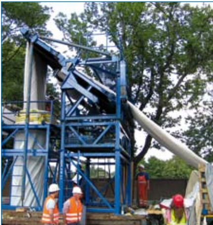
Einbau des Schlauchliners

ein Podest aus Stahlträgern zur Lastabtragung erstellt. Anschließend war ein Autokran beim Aufbau des aus würfelförmigen Stahlbauteilen bestehenden Inversionsturmes behilflich.