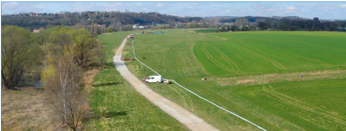
Blick auf die Baustelle mit Baustraße und Wasserhaltung

Aufgabenstellung: Erneuerung eines vorhandenen 3,1 km langen undichten Abwasser-Sammelkanals in ökologisch hochsensibler Elb-Landschaft. Die Erneuerung des alten Betonkanals DN 1200 erfolgte durch die Arbeitsgemeinschaft KUT / Lauber im grabenlosen Relining- Verfahren mit GFK-Wickelrohren DN 1000 des Systems FLOWTITE der Fa. Amitech Germany von Februar bis Juli 2007.