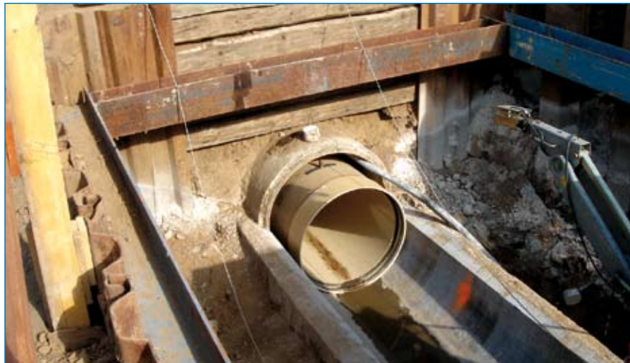
Rohrkopplung im Kanal

trennte Betonsegment setzte man nach erfolgreichem Relining wieder auf, so dass man den ursprünglichen Kanalzustand wieder erhielt.