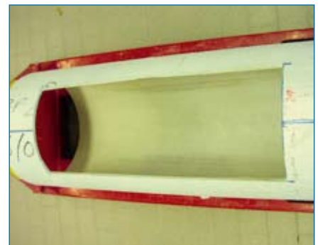
Hochdruckpülversuch nach DIN 19523: Praxisprüfung, IRT Geschwenda, Bild rechts unten: Abriebversuch Kippbinne nach DIN EN 295-3, Ingenieurbüro Siebert und Knipschild

Die Weiterentwicklung des Insituform-Verfahrens im Bereich der eingesetzten Werkstoffe führt dazu, dass der Liner neben dem tragenden und dichten Laminat über ein zusätzlich integriertes Dichtelement verfügt und somit der ausgekleidete Kanal eine doppelte Sicherheit hinsichtlich der Dichtheit unter Betriebsbedingungen aufweist.