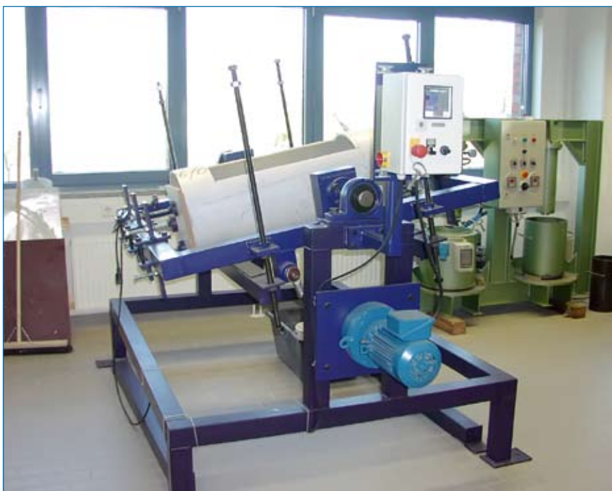
Abriebversuch Kippinne nach DIN EN 295-3, Ingenieurbüro Siebert und Knipschild

Die Insituform Rohrreparaturtechnik GmbH ist die erste Firma, die auf Basis ihrer kontinuierlichen Weiterentwicklung den Eignungsnachweis für die innere Folienbeschichtung (Coating) als integralen Bestandteil eines Schlauchlinersystems mit dem Nachweis einer Lebensdauer von mindestens 50 Jahren unter simulierten Betriebsbedingungen durchgeführt hat.